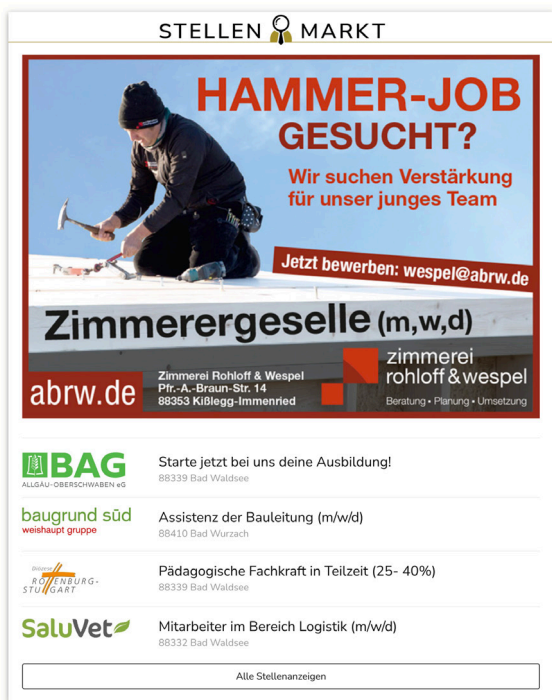
Banner und Listendarstellung im redaktionellen Umfeld