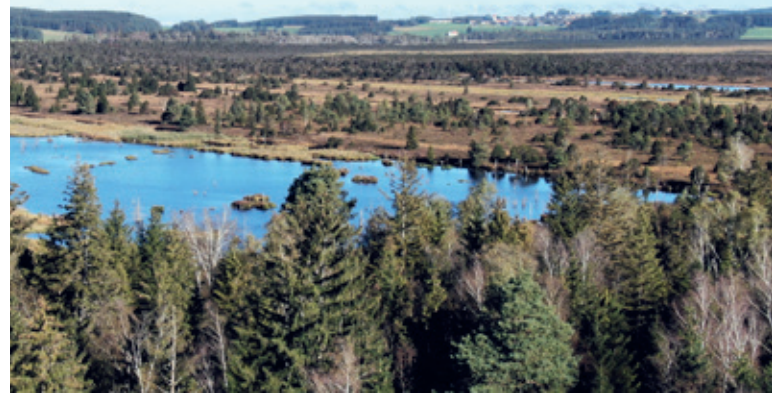
Blick übers Ried Richtung Unterschwarzach aus 40 m Höhe (Drohnaufnahme am geplanten Turmstandort)

Im Ergebnis liegt der Standort am Haidgauer Torfwerk vorn. Nur dieser Standort bietet auch Einblick in die Vielfalt der unterschiedlichsten Lebensbereiche des Riedes. Man kann von dort aus Niedermoor, Hochmoor, Moorwald, Heide, die Wiedervernässung oder