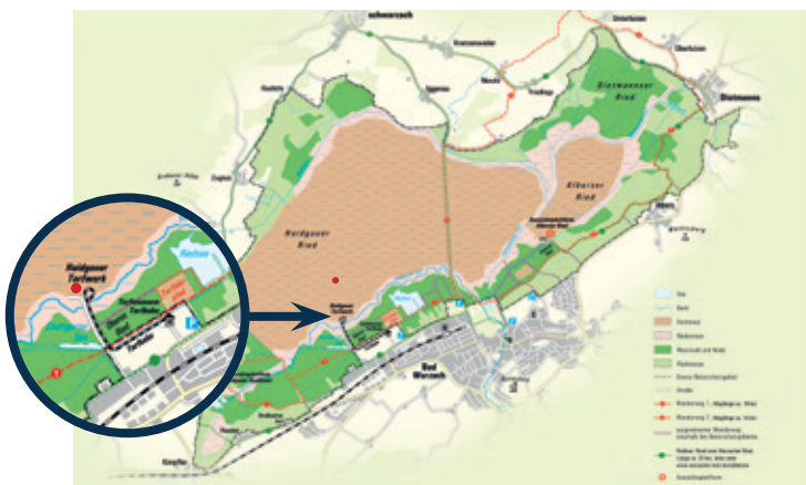
● Geplanter Standort Naturerlebnis- und Beobachtungsturm im Wurzach Ried ganz am Rand der streng geschützten Kernzonen

Im Ergebnis liegt der Standort am Haidgauer Torfwerk vorn. Nur dieser Standort bietet auch Einblick in die Vielfalt der unterschiedlichsten Lebensbereiche des Riedes. Man kann von dort aus Niedermoor, Hochmoor, Moorwald, Heide, die Wiedervernässung oder