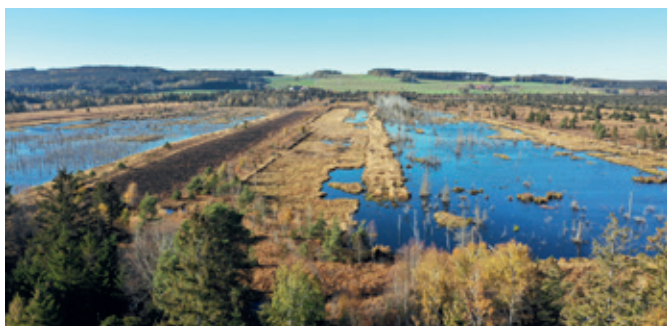
Einblick in die geschützten Zonen hinter dem geplanten Standort des Turmes

Der Turm bleibt im Wechsel der Jahreszeiten ein Anziehungspunkt, weil er einen unmittelbaren Einblick in die geschützten Zonen des Naturschutzgebietes ermöglicht.