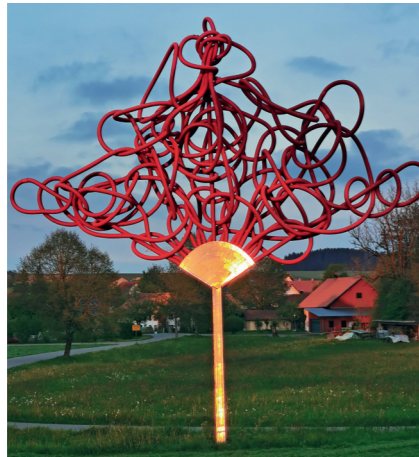
Rose for ai wei wei 2012 Edelstahl, Kunststoff, KH-Lack