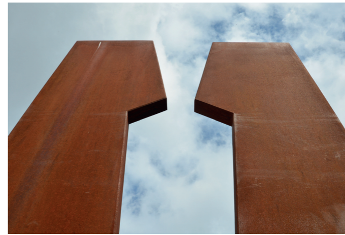
Vollmond 1995 1200, ø 130 cm Stahl, Polyester, Blattgold