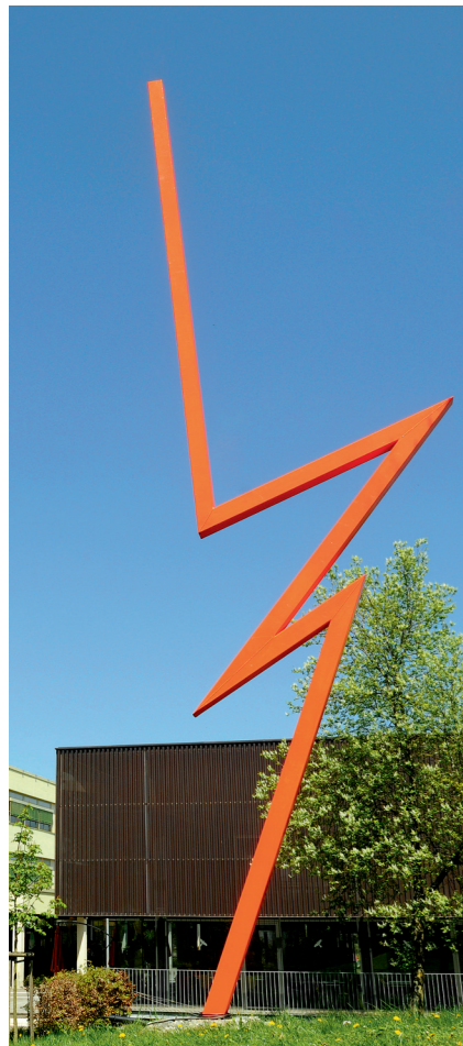
Geistesblitz 2006 1300 x 300 x 14 cm Stahl, KH-Lack